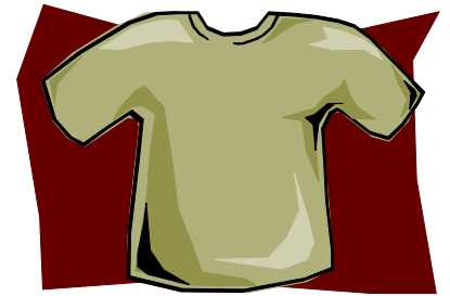
A T-SHIRT tričko