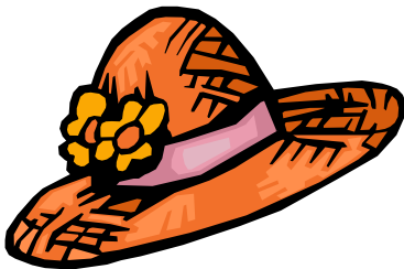
A HAT klobouk