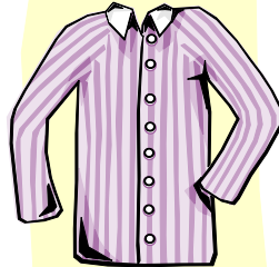
A SHIRT košile